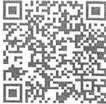
QR code ตรวจสอบรายชื่อ