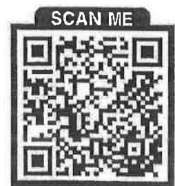
สแกน QR CODE เพื่อดาวน์โหลดรายชื่อ อปท.