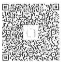
กลุ่มไลน์