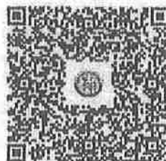
บัญชีรายชื่อ รุ่นที่ ๖ - ๘ LTAX ONLINE

สำนักบริหารการคลังท้องถิ่น กลุ่มงานนโยบายการคลังและพัฒนารายได้ โทร. ๐-๒๒๕๑-๕๐๐๐ ต่อ ๑๔๓๓-๔ ไปรษณีย์อิเล็กทรอนิกส์ saraban@dla.go.th ผู้ประสานงาน โทร. ๐๖๖๒ ๕๖๖๖๖๖ โทร. ๐๖๖๒ ๕๖๖๖๖๖๖๖