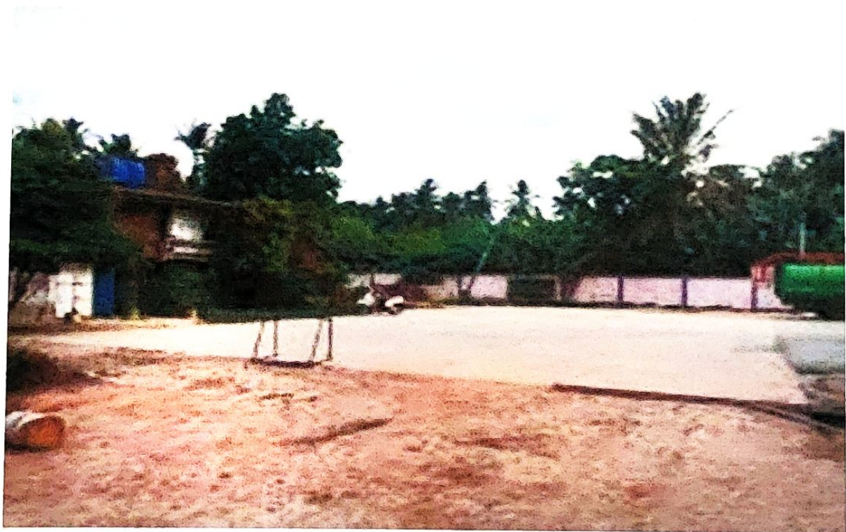
ลานกีฬาบ้านสวนสวรรค์ ม.15