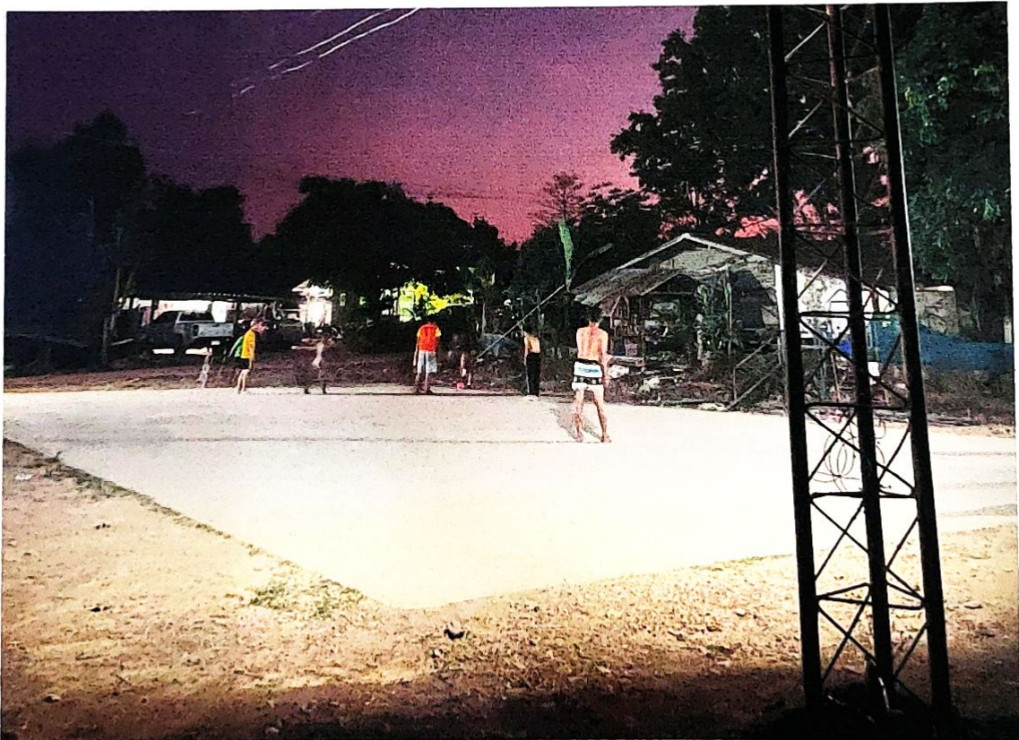
บ้านเทพนา ม.10