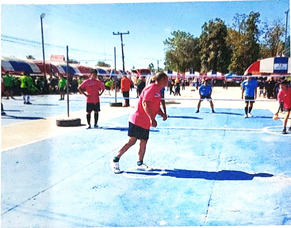
ลานกีฬาบ้านวังใหม่ ม.8