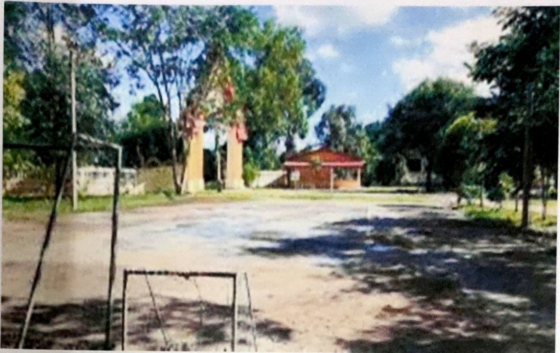
บ้านวังอ้ายโพธิ์ ม.4