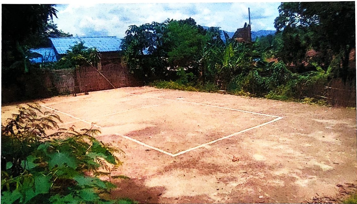
บ้านสวนสวรรค์ ม.12