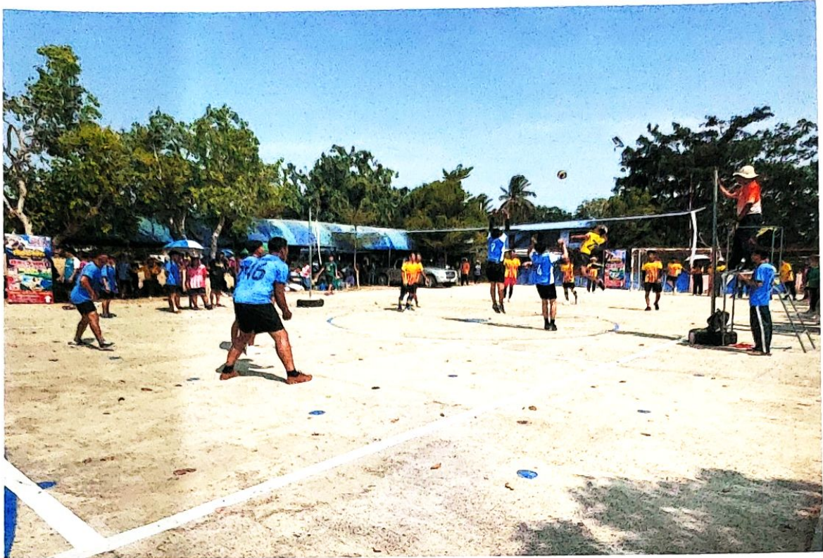
ลานกีฬาบ้านไร่พัฒนา ม.11