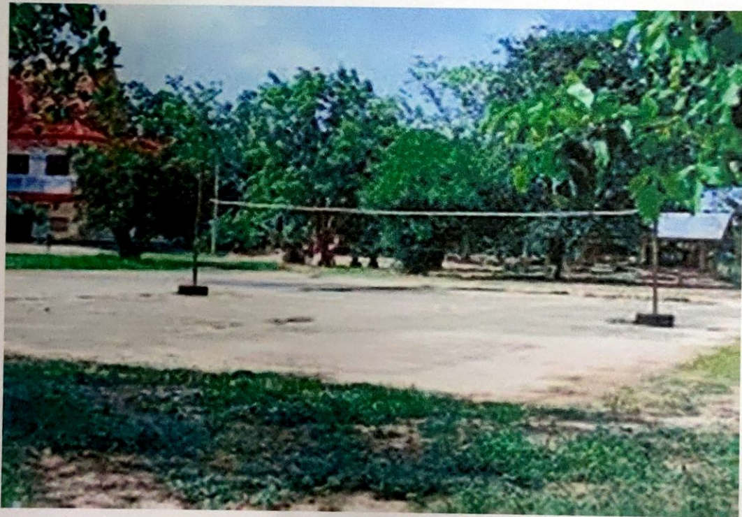
ลานกีฬาบ้านวังตาเทพ ม.5