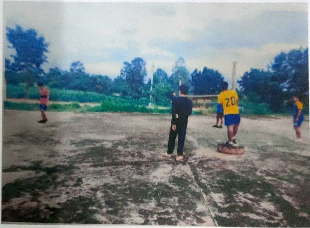
บ้านวังอ้ายคง ม.6