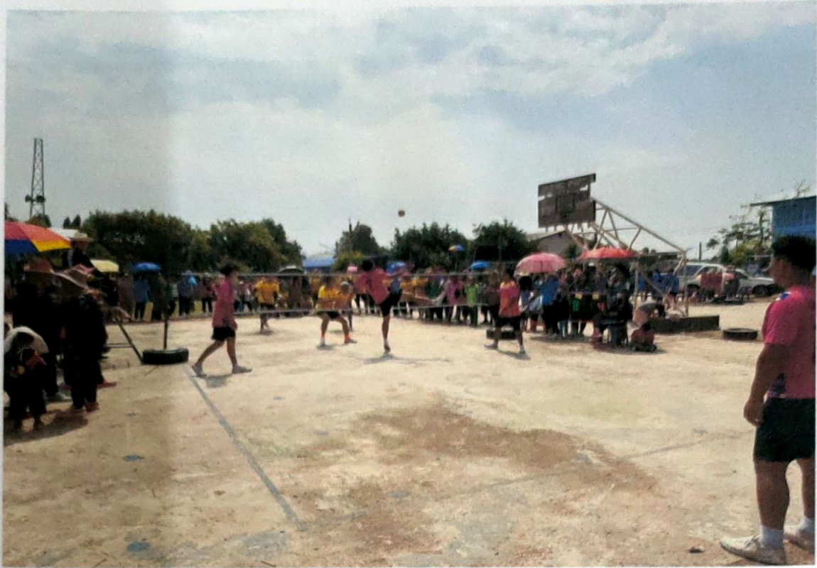
ลานกีฬาบ้านไร่ ม.1