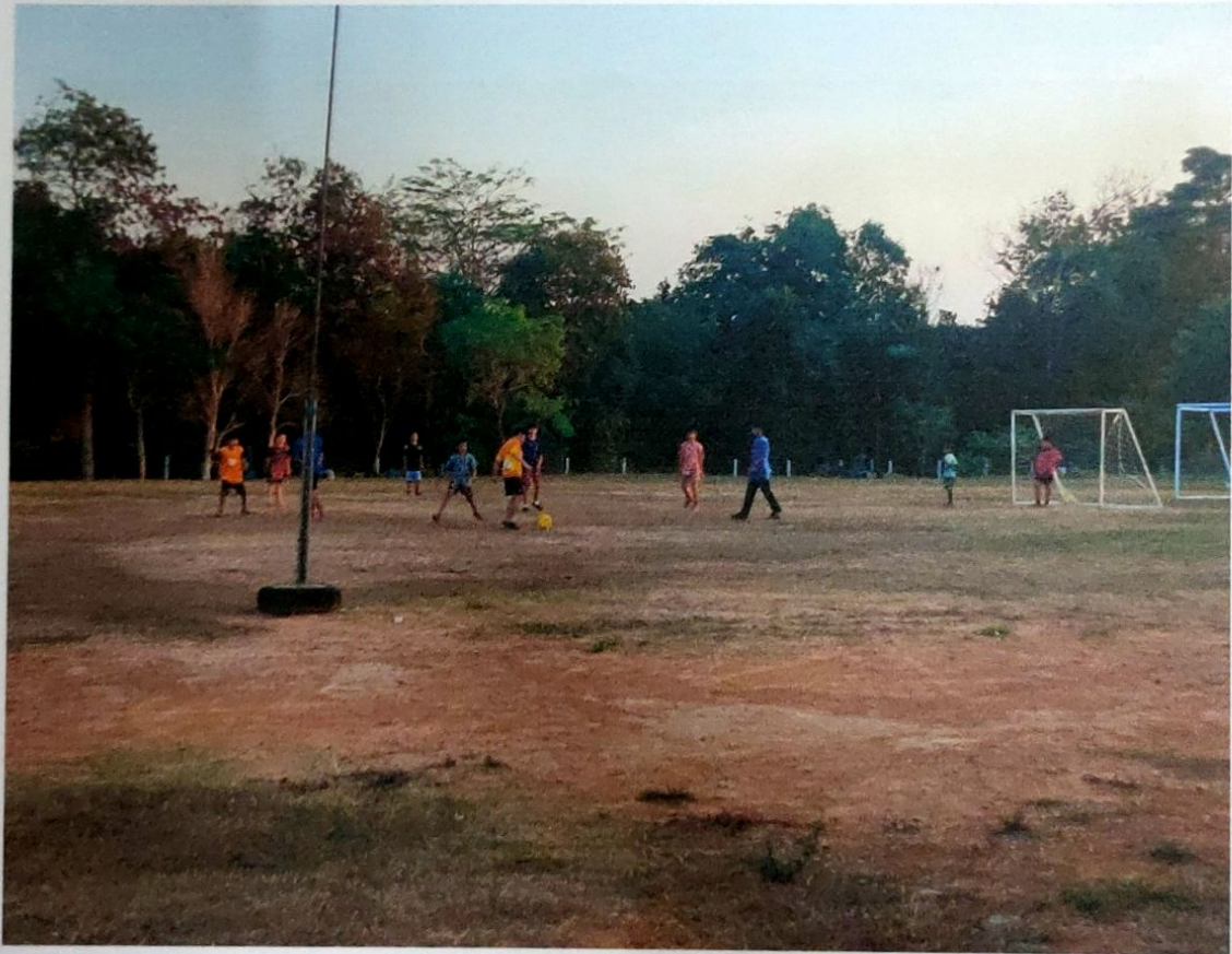
ลานกีฬาบ้านโนนสำราญ ม.2