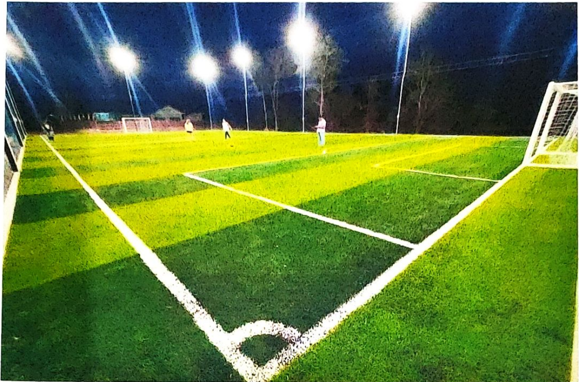
ลานกีฬาบ้านวังขวาง ม.14