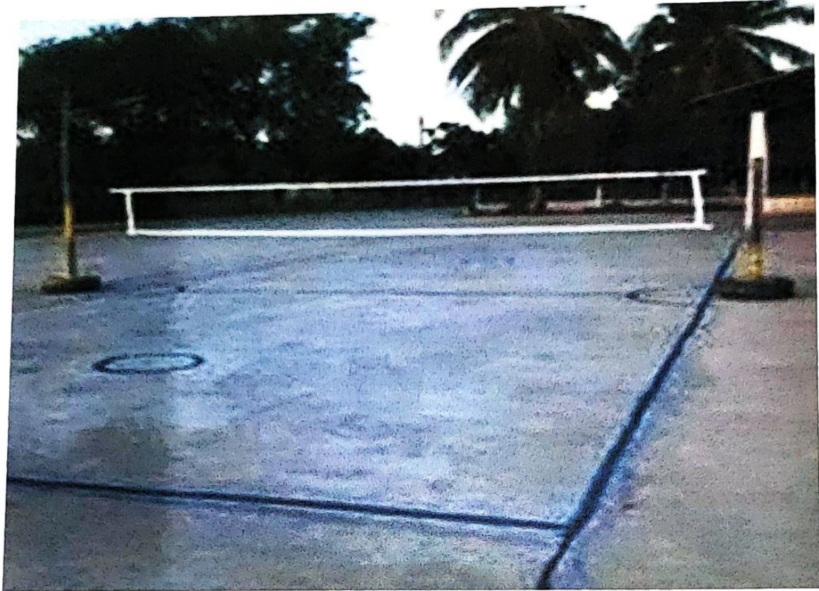
ลานกีฬาบ้านเทพอวยชัย ม.16