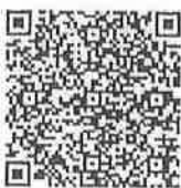
ตัวอย่างเอกสารการคัดเลือก อถล.