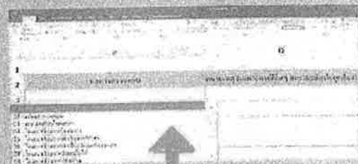
2.เลือก ผลการตรวจสอบจากตัวเลือก