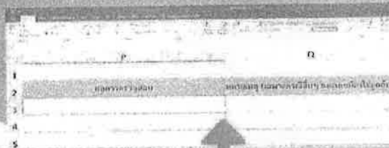
1.เลือก DROP-DOWN LIST