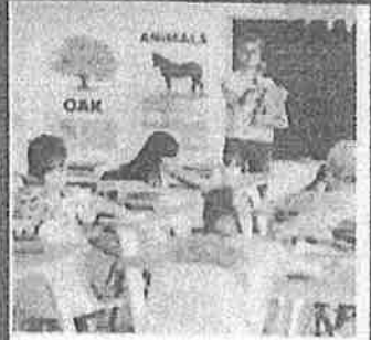
แบบประเมินตนเองสำหรับ สถานศึกษาดำเนินงานอนามัย โรงเรียน ปีการศึกษา 2566

เลือก "แบบประเมิน ตามมาตรการสุขลักษณะ" และ "แบบประเมินตนเองสถานศึกษา"