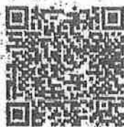
QR Code ลงทะเบียน