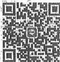
QR Code เข้าร่วมกลุ่มไลน์