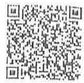
มาตรการฉบับเต็ม

ดาวน์โหลด ศพด. ที่อยู่ในเขตที่สีแดงเข้มและสีเหลืองให้ดำเนินการตามมาตรการตาม น.ส. มท. ที่ มท 0816.4/ว 2993 ลว. 25 พ.ศ. 64