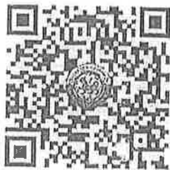
QR Code ๑ ยืนยันการเข้าร่วมประชุม