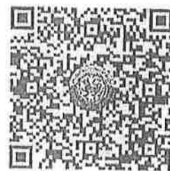
QR Code ๒ ตรวจสอบจำนวนผู้ชำระค่าลงทะเบียนแต่ละรุ่น