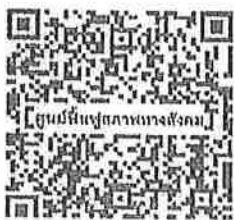
เอกสารแนบ