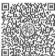
ความเป็นมาวันเยาวชน

กองส่งเสริมและพัฒนาการจัดการศึกษาท้องถิ่น กลุ่มงานส่งเสริมการศึกษานอกระบบ ศิลปะ วัฒนธรรม และภูมิปัญญาท้องถิ่น โทร. ๐-๒๒๕๑-๕๐๒๑-๓ ต่อ ๔๐๓ โทรสาร ตย ๔๑๘ ไปรษณีย์อิเล็กทรอนิกส์ saraban@dla.go.th