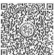
แบบรายงานผล การดำเนินกิจกรรม