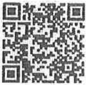
เอกสารเพิ่มเติม