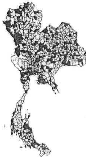
รูปที่ 4 แผนที่แสดงอำเภอเสี่ยงสูงต่อการระบาดของโรคไข้เลือดออก พ.ศ. 2565

หมายเหตุ สามารถดูรายชื่ออำเภอได้จากเว็บไซต์กองโรคติดต่อฯ โดยแมลง https://ddc.moph.go.th/dvb