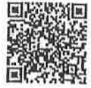
กฎกระทรวงฯ

ไปรษณีย์อิเล็กทรอนิกส์ Se_registration@osep.mail.go.th