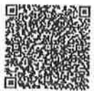
รายชื่อฯ