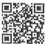
QR code สำหรับ ทราบในะคลังที่ส่งมาด้วย

สำนักงานปลัดกระทรวง สำนักพัฒนาและส่งเสริมการบริหารราชการจังหวัด โทร./โทรสาร ๐ ๒๒๒๑ ๙๒๐๐