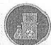
ถังขยะสีแดง