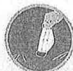
คัดแยกขยะ