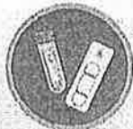
ชุดตรวจ Antigen Test Kit