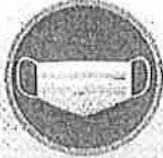
หน้ากากอนามัย

รณรงค์ประชาสัมพันธ์ให้ประชาชนคัดแยกมูลฝอยติดเชื้อชุมชน เช่น หน้ากากอนามัย หน้ากากผ้า ชุดตรวจ Antigen Test Kit ขณะที่เป็นเป็นเน่ามูก น้ำลาย หรือสารคัดหลั่ง จากการแยกกักตัวที่บ้าน (Home Isolation) และการแยกกักตัวในชุมชน (Community Isolation) โดยคัดแยกใส่ถุงต่างหาก แล้วทิ้งในถังขยะสีแดง หรือ จุดรวบรวมเฉพาะ