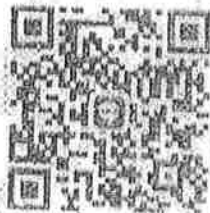
QR Code Line กลุ่ม ทะเบียนแหล่งน้ำ จ.ชัยภูมิ

หมายเหตุ หากมีข้อสงสัย สอบถามข้อมูลเพิ่มเติมได้ที่ นางสาวกานทิณี เพ็ญศิริ ตำแหน่ง วิศวกรโยธาชำนาญการ โทรศัพท์ ๐๙ ๗๓๑๐ ๓๕๘๘ หรือ Line กลุ่ม ทะเบียนแหล่งน้ำ จ.ชัยภูมิ ตาม QR Code Line กลุ่ม ด้านล่างนี้